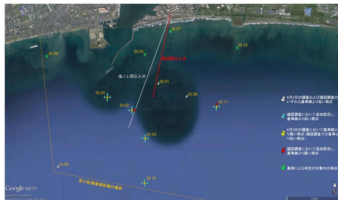
図3 基準線より高い地点の配置