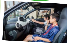
クルマのCO2排出量の計算