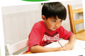
SDGsと脱炭素について