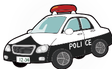
パトカーに乗ってみよう!