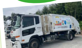
ゴミの分別・収集車の展示